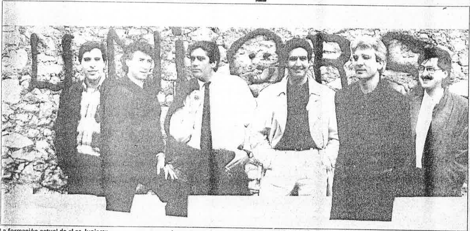
La formación actual de «Los Juniors».