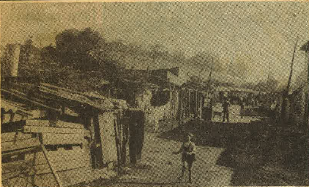
El chabolismo sigue siendo un problema prioritario para la Corporación gijonesa