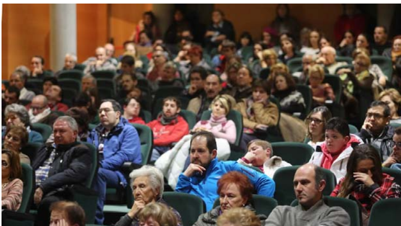
Más de 300 familiares de personas con discapacidad llenaron el salón de actos del Centro Municipal Integrado Gijón-Sur.

Antes de la reunión, Blanco aseguró que «ofrecemos subvenciones para que puedan usar sus furgonetas fuera del horario escolar», algo que en Feaps «no consta».