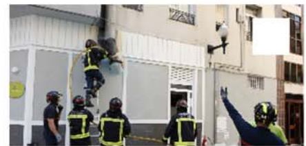
Incendio en un céntrico restaurante de Gijón