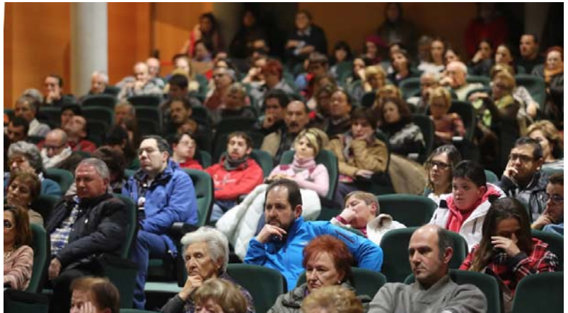
Más de 300 familiares de personas con discapacidad llenaron el salón de actos del Centro Municipal Integrado Gijón-Sur.

Antes de la reunión, Blanco aseguró que «ofrecemos subvenciones para que puedan usar sus furgonetas fuera del horario escolar», algo que en Feaps «no consta».