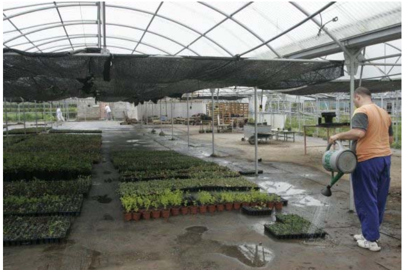
Instalaciones de 'Una ciudad para todos'.