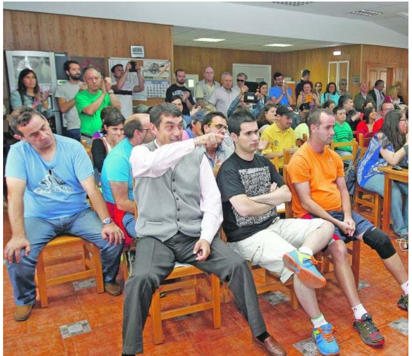
Usuarios del centro y familiares, durante el acto.