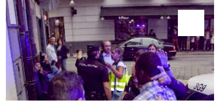
Detención de "Makelele" en Gijón