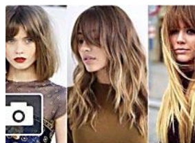
Cortes de pelo 2016: ¿Cuál te sienta mejor?