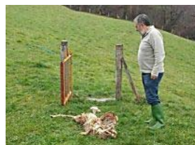
Nueve ovejas muertas, cinco heridas y varias más desaparecidas en Cabrales por un ataque del lobo