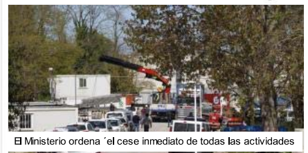
El Ministerio ordena 'el cese inmediato de todas las actividades'