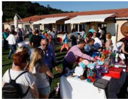
"Una ciudad para todos" celebró su 45.º aniversario JUAN PLAZA

La asociación "Una ciudad para todos" celebró el pasado jueves en la finca de Vegapresas una fiesta para usuarios y familiares con la que se pretendía conmemorar el 45.º aniversario de esta organización. La celebración sirvió también para analizar el intenso trabajo que a lo largo de este año se ha desarrollado en el centro especial de empleo que depende de la asociación. En la fotografía, participantes en la celebración.