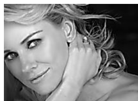
Regalos para el Día de la Madre