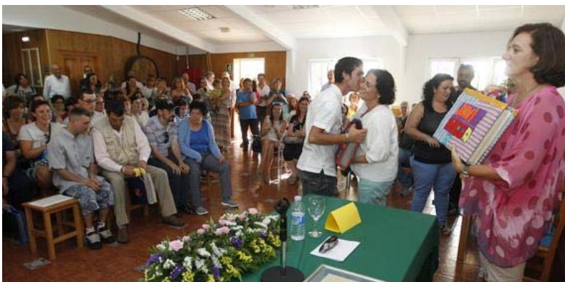
Un momento de la fiesta anual de la asociación 'Una ciudad para todos'.

El acto continuó con la proyección de un vídeo resumen del año, que sembró las risas entre los usuarios, y la entrega de los trabajos realizados durante el curso. Todos ellos concluyeron la fiesta con una animada merienda que puso la guinda a un acto en el que se confirmó la gran labor social de la asociación.