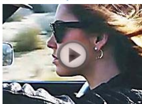
Chiara Ferragni, la bloguera de moda más influyente del mundo